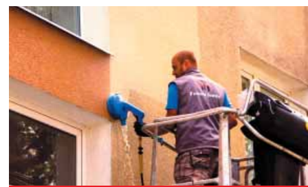
Speciální nástavce a nízkotlaká pára působí na fasády šetrně. Na rozdíl od běžné tlakové vody.

Podobně před asi před 10lety rozpoznal výhody parního čištění povrchů a od té doby stroje firmy Osprey Frank patří k výbavě jeho firmy. Škála jejich nasazení je velmi široká: od odstraňování mastnoty v továrních provozech, revitalizaci kamenných ploch a schodišť, přes