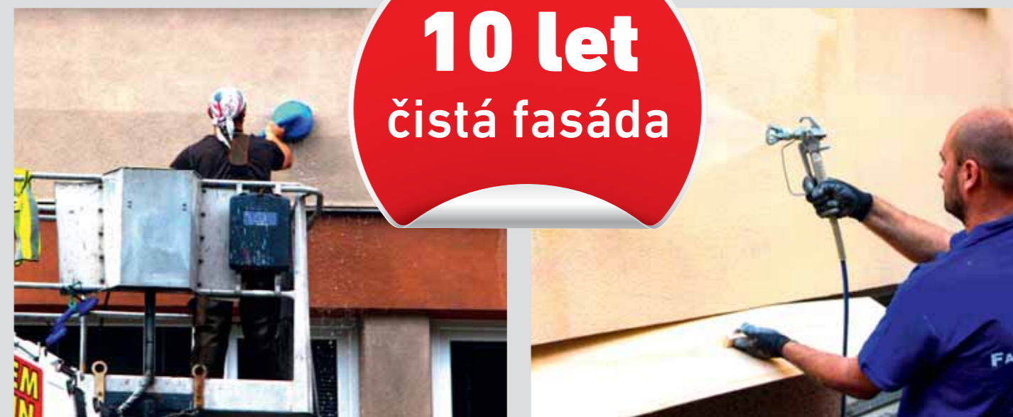
Čištění patentním systémem TURBO FORCE 30 bar.