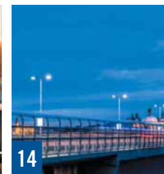
14 Světlo pro Prahu