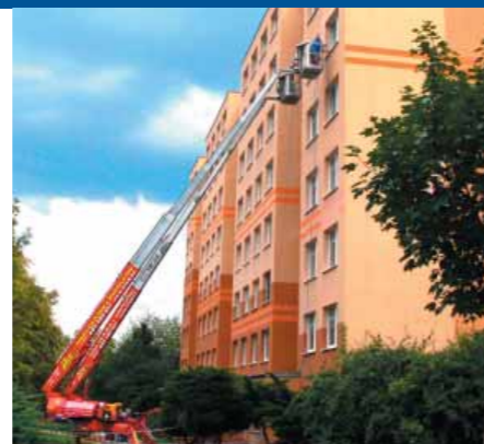
Údržba domovní obálky prováděná ze zdvižných plošin je nejbezpečnější možný způsob.

Kvůli šetrnému přístupu svým zákazníkům také, pokud je to jen trochu možné, nabízí provedení prací z vysokozdvížných plošin. Protože při práci „z lana“ vždy hrozí poškození povrchu