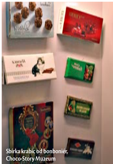
Sbírka krabic od bonboniér, Choco-Story Muzeum

Snažím se o to, ale je to dost obtížné, protože stále vznikají nové firmy a průmysl se vyvíjí. Teď je velmi pozitivní trend v čokoládovém průmyslu. Asi od druhé poloviny 80. let se začíná prosazovat čokoláda z kvalitních jednodruhových kakaových bobů z určitých oblastí, s vysokým obsahem kaka. Pomalu, ale jednoznačně se lidé přeorientovávají z mléčných čokolád na hořké druhy a cíleně si i kupují čokoládu dražší, ale kvalitnější. Když máte hořkou, třeba 70 % čokoládu, stačí vám