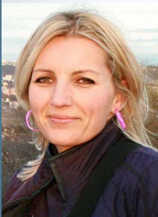
ZPRÁVODAJ HOSPODÁŘSKÉ KOMORY HLAVNÍHO MĚSTA PRAHY

Dokonce mě oslovili ze zahraničí, ale s příchodem krize ta jednání nějak usnula. Chtěli, abych jim vyráběla to samé s jejich designem. Samozřejmě na úspěchu neusínám. Mám připravenu limitovanou edici, která se bude skládat asi z 6 výrobků. Stejným tématem kolekce budou barvy. Každý rok nový výrobek ve dvou barvách a s jinou náplní, vždy vyfocenu na víčku. Na jeden z těch výrobků zvažuji umístit