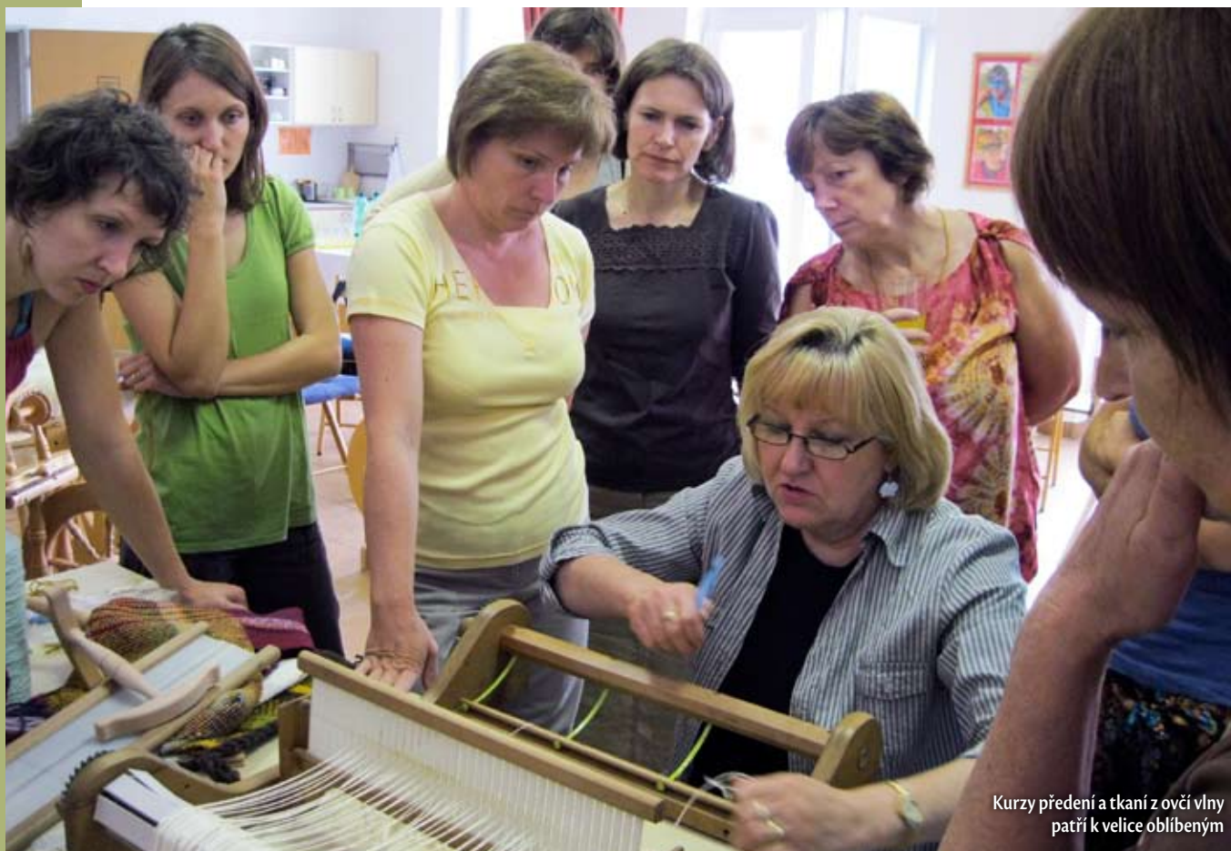
Kurzy předení a tkaní z ovčí vlny patří k velice oblíbeným