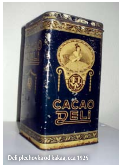
Deli plechovka od kaka, cca 1925

Jsou i mladší sběratelé. Mému největšímu konkurentovi je teprve něco málo přes třicet a už má přes sto tisíc obalů. Ale je to tím, že spojil dvě sbírky, něco také odkoupil. Já si to