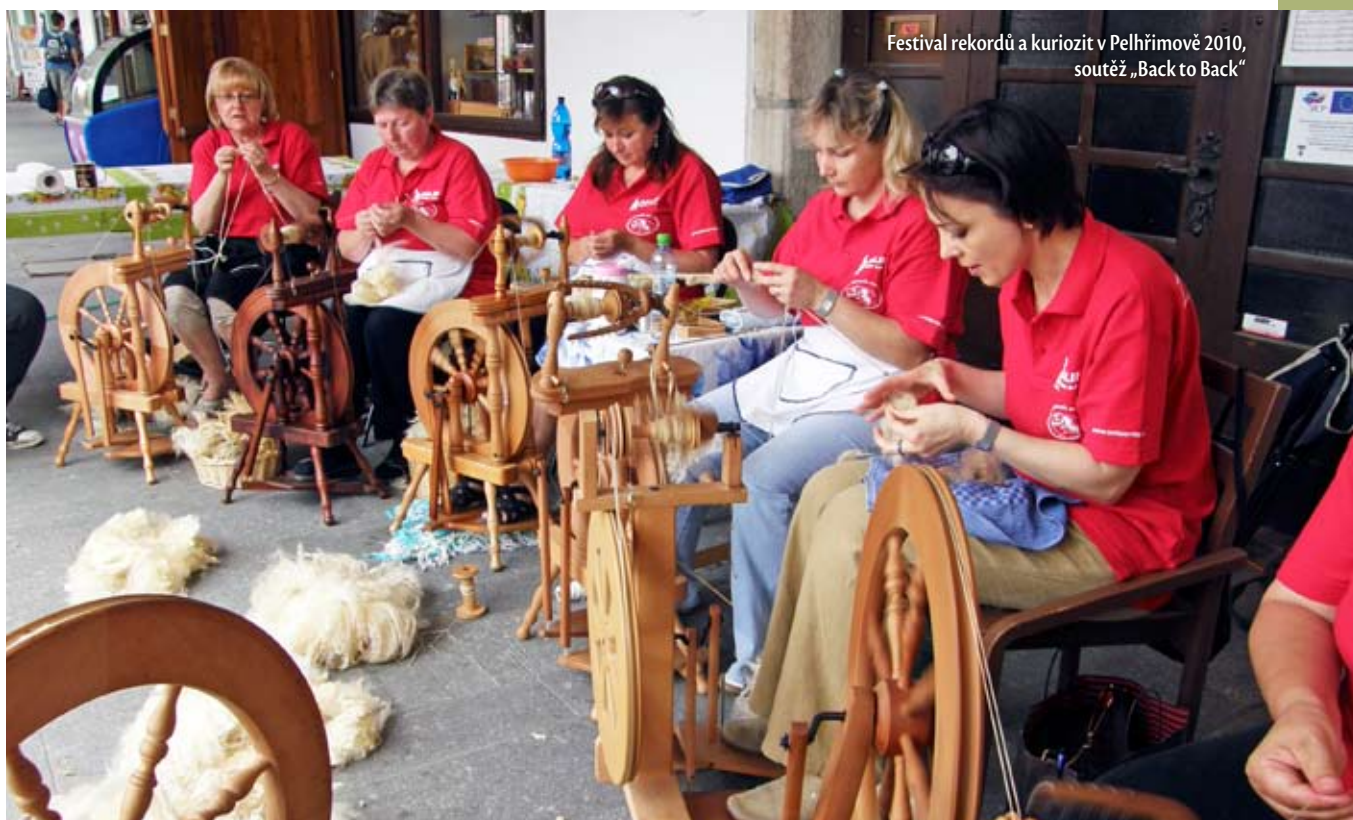
Festival rekordů a kuriozit v Pelhřimově 2010, soutěž „Back to Back“